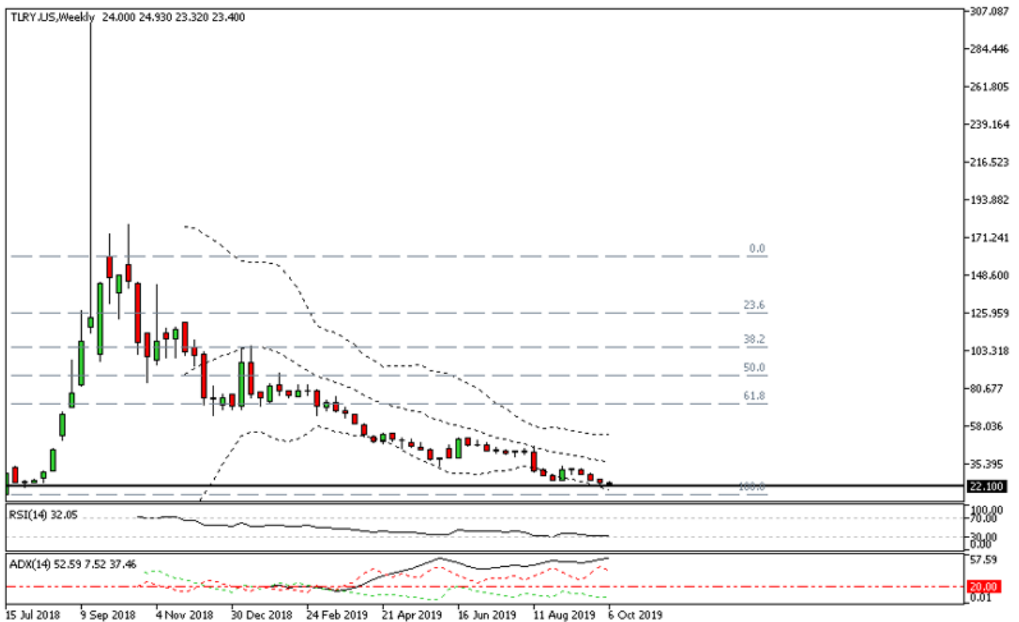
Tilray semanal

Pero durante el último año los títulos de la compañía se depreciaron un 90%, desde 210 a 23 dólares por acción. En el gráfico semanal de Tilray, cortesía del broker ActivTrades, observamos que en estos momentos cotizan cerca del mínimo histórico que estableció en 22,10 dólares pocos días después de su salida a bolsa. Por lo tanto, si acabase perdiendo este nivel de precios entraría técnicamente en caída libre.