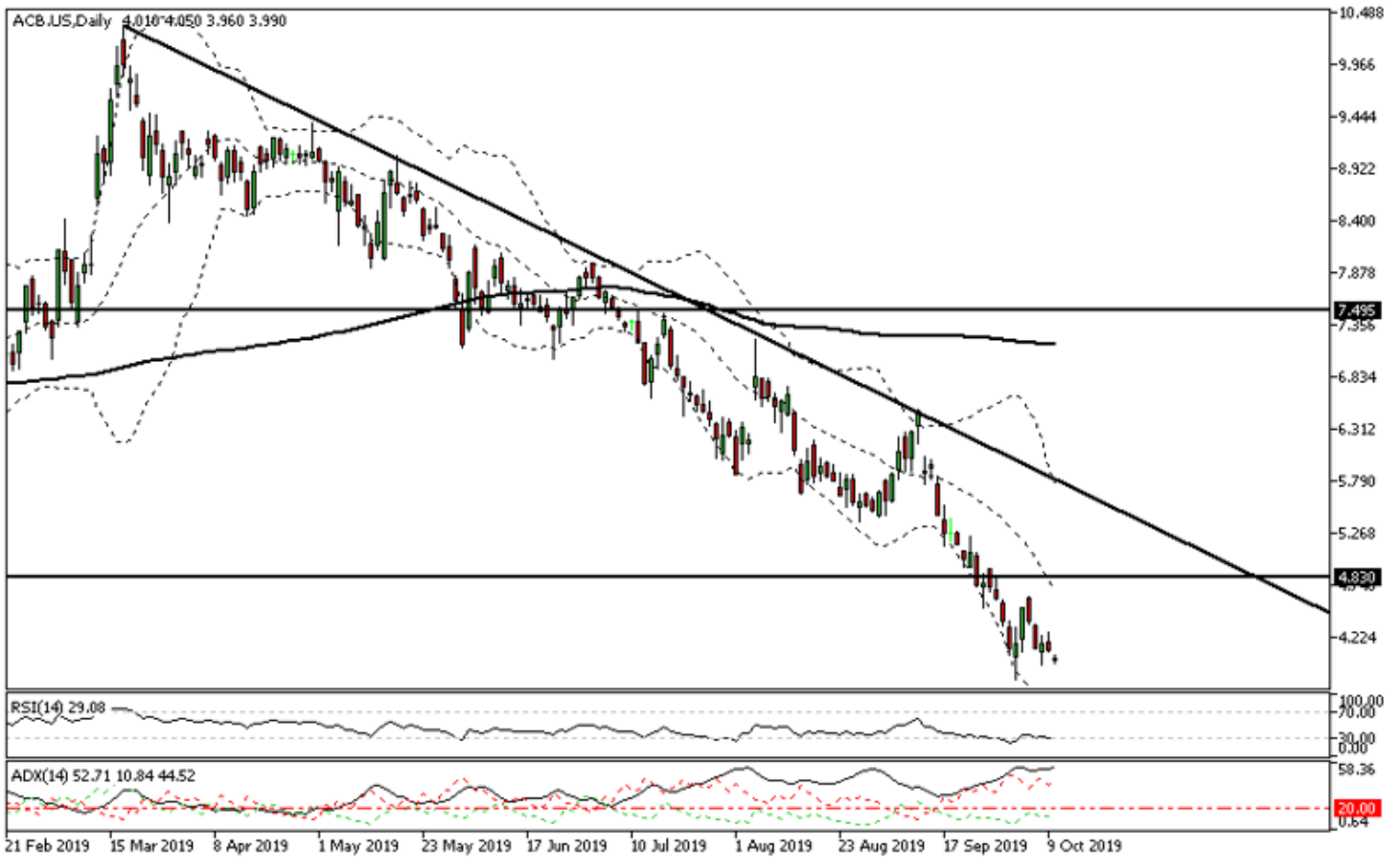
Aurora Cannabis diario

En los dos primeros meses de negociación en Wall Street los títulos de Aurora Cannabis cayeron hasta el soporte de los 4,80 euros, en este nivel de precios cotizó en rangos durante unos meses, hasta que enero de este año retomó la senda alcista y a mediados de marzo alcanzaba los 10 dólares por acción.